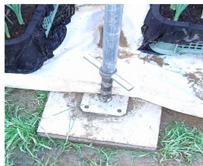
ジャッキ付きの台